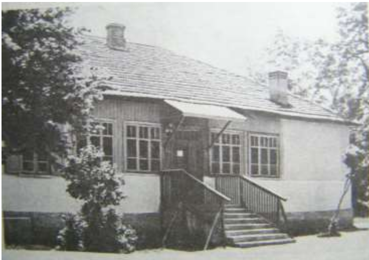
Дом в Долинске, где размещался штаб 115-й Кабардино-Балкарской кавалерийской дивизии с конца 1941-го по май 1942 года

Следует отметить, что в это воинское соединение, принимавшее участие в боях против немецко-фашистских захватчиков в Ростовской и Сталинградской областях, по мобилизации призывались и сотрудники Управления милиции Народного комиссариата внутренних дел республики.