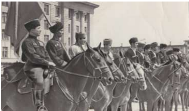
Бойцы 115-й кавалерийской дивизии перед отправкой на фронт. Май 1942 года