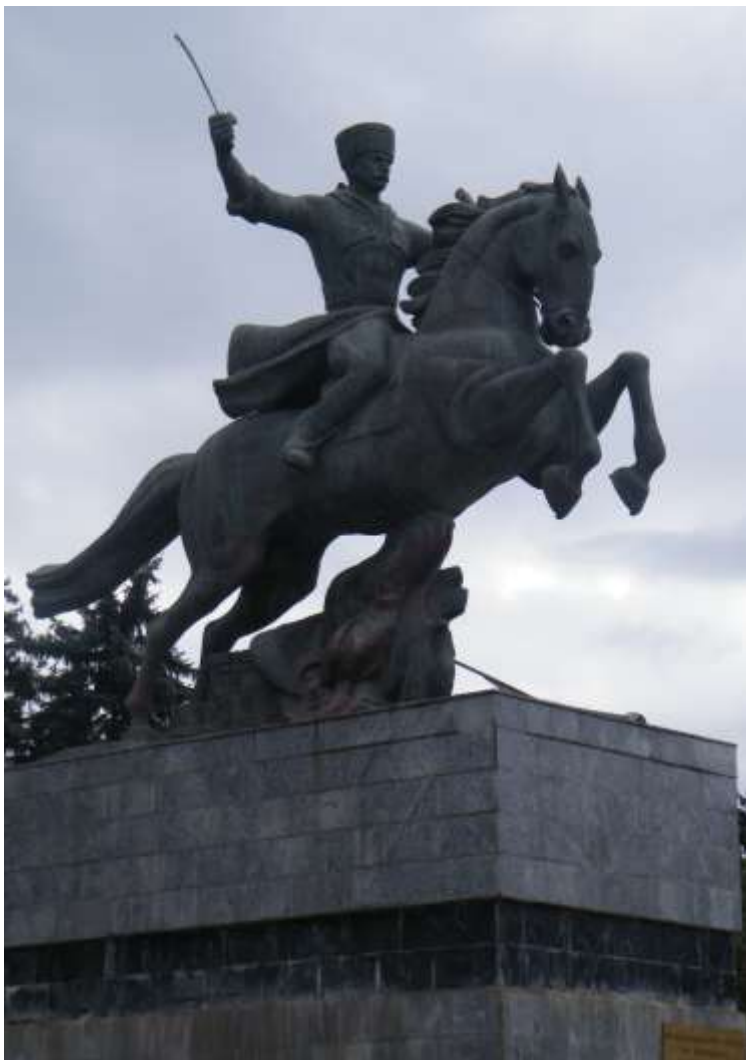
Памятник воинам 115-й кавалерийской дивизии в городском округе Нальчик