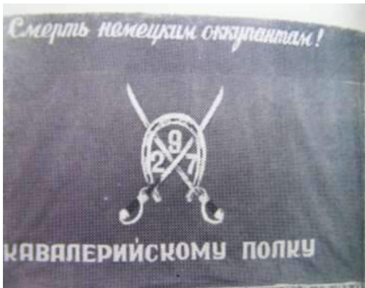
Знамя 297-го кавалерийского полка 115-й кавалерийской дивизии.

Личный состав 115-й кавалерийской дивизии был настроен дать решительный отпор немецко-фашистским захватчикам.